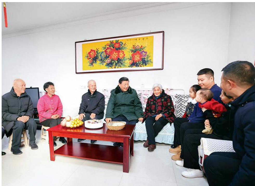
同村民杜洪刚一家人亲切拉家常。

2024年2月1日至2日，中共中央总书记、国家主席、中央军委主席习近平来到天津，看望慰问基层干部群众。这是1日上午，习近平在西青区辛口镇第六埠村考察时，